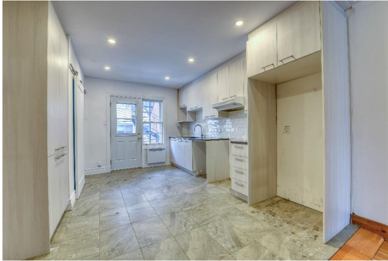
Rez-de-chaussée - Loué / Ground Floor - Rented