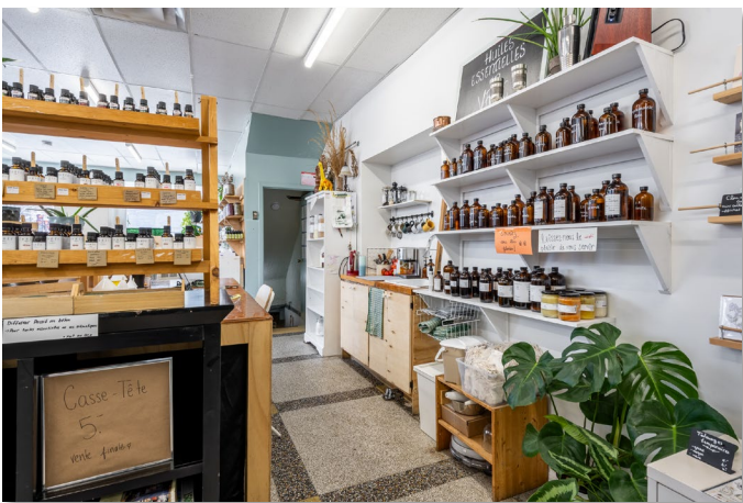
Espace arrière // Back area