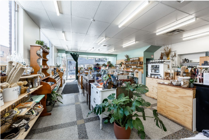
Espace avant // Front area