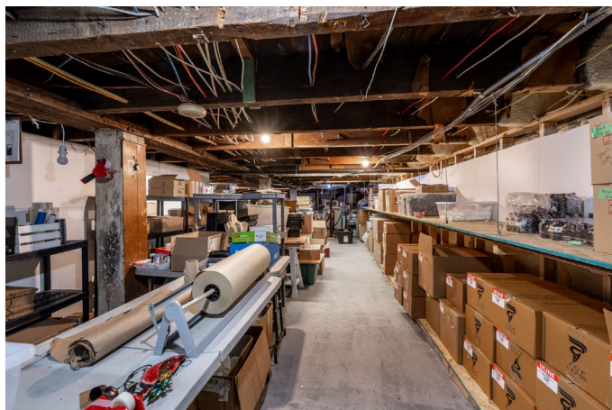
Espace de stockage // Storage space