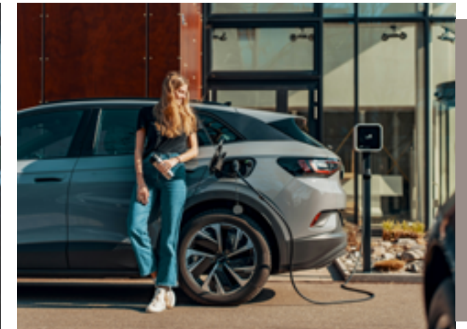
Bornes de recharge