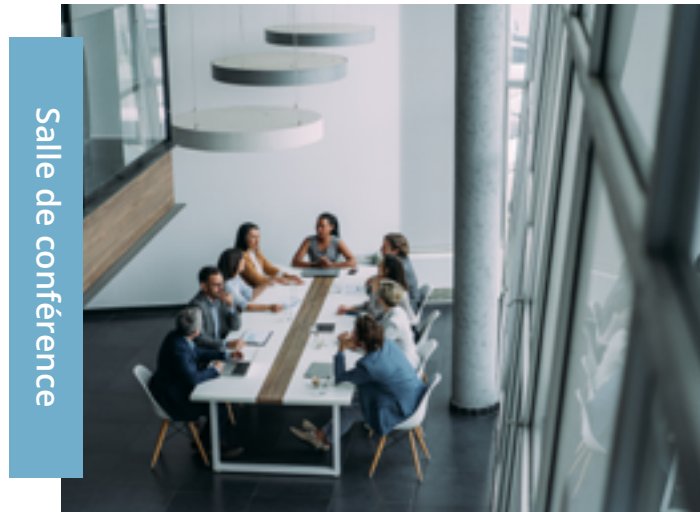
Salle de conférence