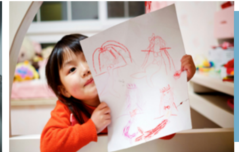
Service de garderie